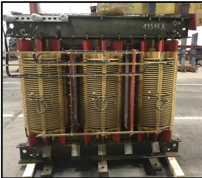
Unidad antigua averiada