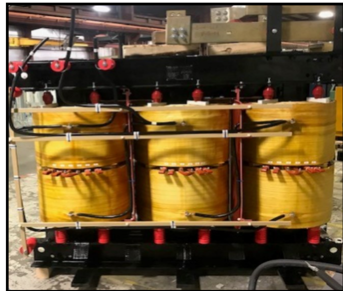
Unidad recién reconstruida