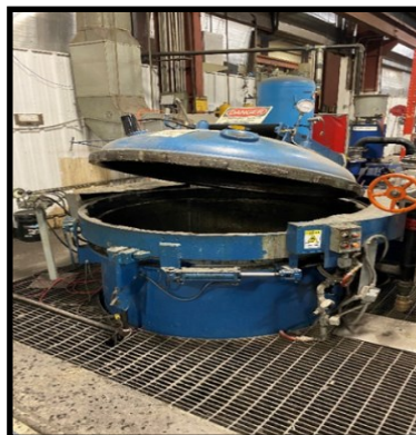
Impregnación a presión al vacío